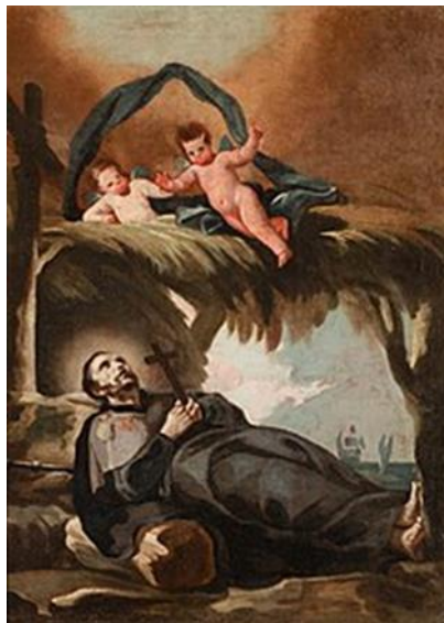
Śmierć św. Franciszka Ksawerego, Francisco Goya, 1771-1774