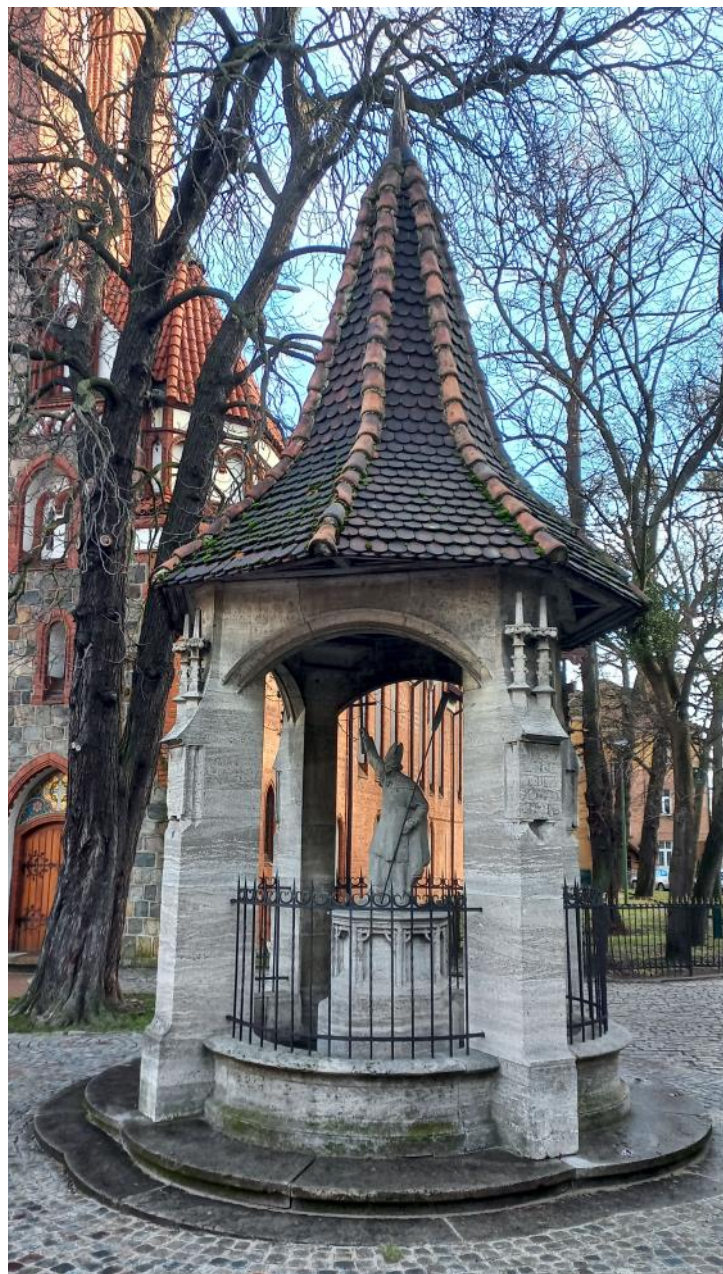
Kapliczka św. Wojciecha przy kościele garnizonowym p.w. św. Jerzego w Sopocie (bud. 1909 r.)

Fragmenty homilii św. Jana Pawła II podczas Mszy św. w Sopocie z okazji 1000-lecia chrztu Gdańska (5 czerwca 1999) przywołujemy w ramach przygotowania do jubileuszu 100-lecia Archidiecezji Gdańskiej i w roku 25. rocznicy pobytu Ojca Świętego w Sopocie.