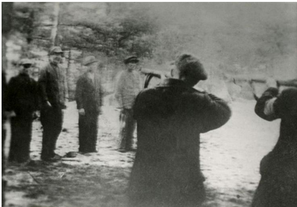
Po lewej: Pomnik ofiar Piaśnicy. Powyżej: Mord w lasach piaśnickich