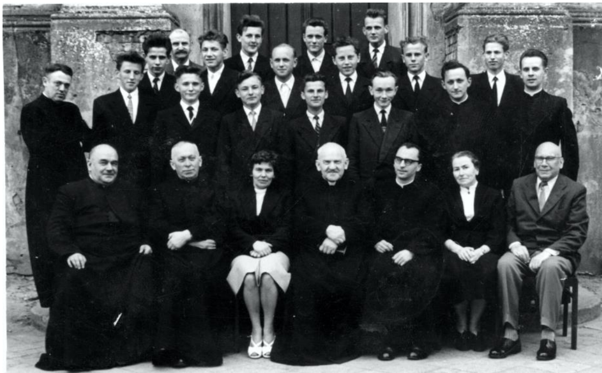
Collegium Marianum – Niższe Seminarium Duchowne w Pelplinie – rok 1960.