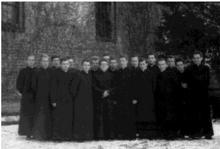
Oblóczyny kleryków w roku 1961

5. Pierwszy rocznik do Kaplicy przychodził w garniturach i pod krawatem. Sutannę, czyli strój kapłański otrzymywaliśmy dopiero w czasie drugiego roku studiów. Było to zwykle w listopadzie w święto św. Stanisława Kostki (dokładnie 13 listopada - tak stanowił dawny kalendarz liturgiczny). Łączyło się to z pewną, udokumentowaną uroczystością. Uroczystość ta polegała na „opłakiwaniu krawatów” i robieniu historycznych zdjęć: pierwsze z krawatami, a kolejne już bez krawatów.