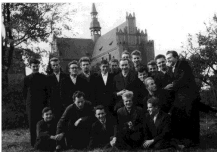
Rocznik kleryków Wyższego Seminarium Duchownego w Pelplinie - listopad 1960 - 1961

1. Jest rok 1960. Dla mnie i każdego z moich kolegów bardzo szczególny. Tu i teraz rozpoczęła się „ostatnia prosta” do kapłaństwa. Pelplin jako małe miasto koło Tczewa nadal pozostało miejscem moich studiów. Gmach kolejnej mojej Uczelni był mi raczej, od zewnątrz znajomy, gdyż mury kilku budowli łączyły się ściśle ze sobą. To co było wyraźnie różne to tablica informacyjna przy głównym wejściu. A może nawet tylko jedno słowo „Wyższe”, Wyższe Seminarium Duchowne w Pelplinie. Nigdy nie zastanawiałem się nad tym, kiedy taka tablica została zawieszona, ale dla nas było to rzeczą naturalną, że skoro skończyliśmy Niższe Seminarium Duchowne, to obecnie trzeba przejść do Wyższego Seminarium.