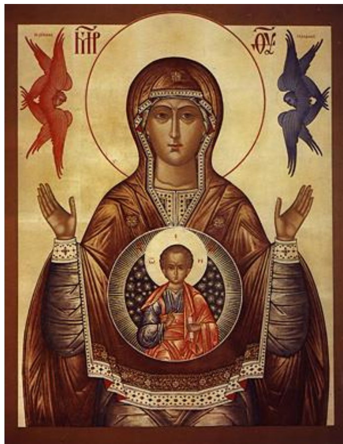
Raniero Cantalamessa, Od Ewangelii do życia

1 stycznia to także Światowy Dzień Pokoju. Matka Boga jest pokojem przepelniona, ale wynika on z tego, że jest przepelniona Bogiem. Gdy dziś szukamy pokoju, szukajmy Boga, szukajmy modlitwy, szukajmy Jego woli. Nic nie jest nam tak potrzebne jak pokój, prawdziwy i trwały, który płynie z jedności z Bogiem.