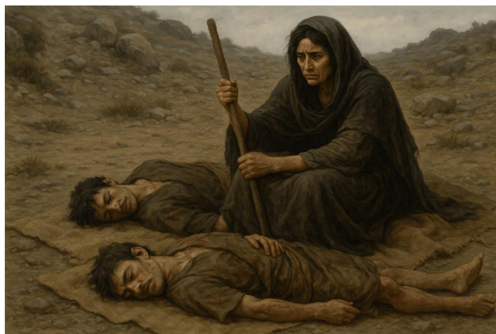
Gianfranco Ravasi, Twarze Biblii

Jednak Rispa nie poddała się. Włożyła płaszcz żałobny uszyty z worka i "rozłożyła go na skale". Od początku żniw aż do zroszenia ciał deszczem nie pozwałała, by ptactwo i zwierzęta rzuciły się na ciała zabitych. Zawiadomiono Dawida o tym, co zrobiła Rispa. Wówczas król, wzruszony wiernością matczynej miłości, postanowił zabrać ciała powieszonych i wydał rozkaz, by pochować je razem z kośćmi Saula oraz jego syna Jonatana w rodzinnym grobowcu.