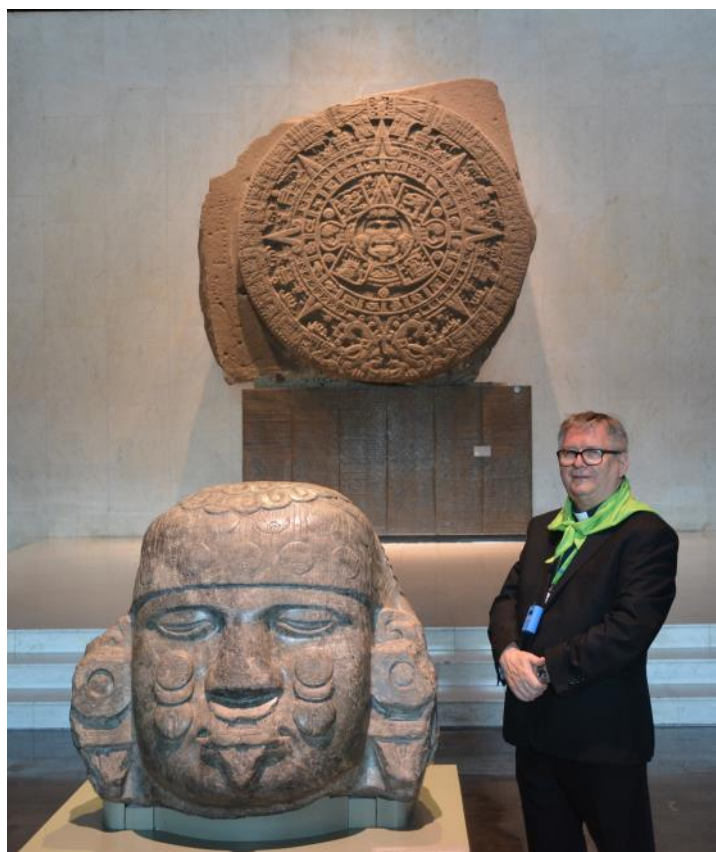
Autor przy kalendarzu Azteków

Ciąg dalszy w następnym numerze „Barki”.