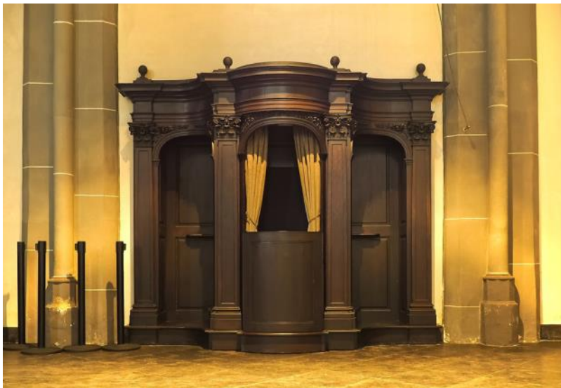
Początki mojej posługi w konfesjonale.

Nowa, dłuższa formuła rozgrzeszenia wskazuje, że pojednanie penitenta ma źródło w miłosierdziu Boga