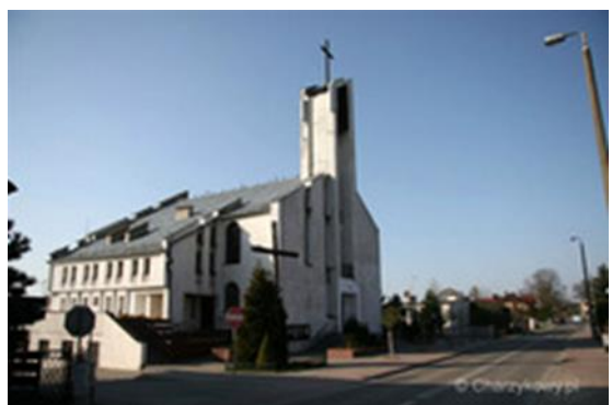
Charzykowy – to już nie kaplica, ale kościół doby obecnej