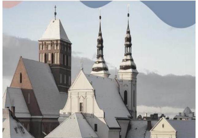
Fara i kościół Szkolny w Chojnicach.

W odległości kilku kilometrów były kościoły filialne kolejno w: Nieżychowicach, Moszczenicy i Charzykowach.