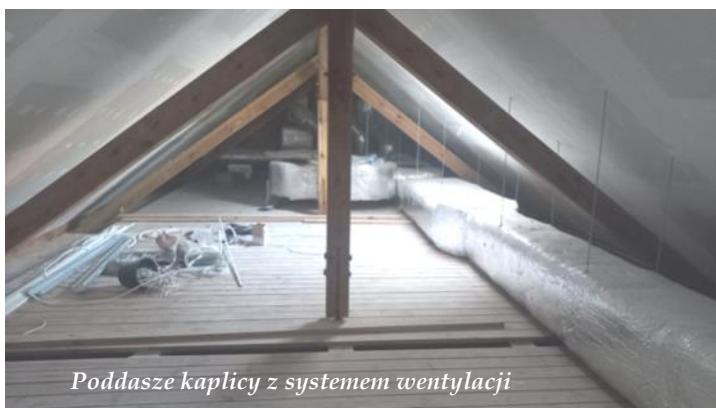
Poddasze kaplicy z systemem wentylacji

Remont prowadzony jest pod nadzorem Wojewódzkiego oraz Miejskiego Konserwatora Zabytków.