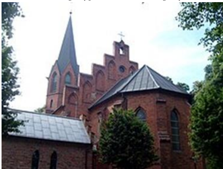
Gruczno. Kościół parafialny Zygfryda.

W szkołach tego typu kładziono szczególny nacisk na