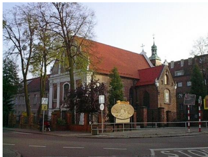
Kościół św. Anny. OO. Franciszkanie. Klasztor OO. Reformatorów /Franciszkanów.

W czasie okupacji w konwiktzie mieścił się magazyn a w pomieszczeniach mieszkalnych biura zaopatrzenia ludności. Od 1945 roku w konwiktzie był szpital zakaźny dla byłych