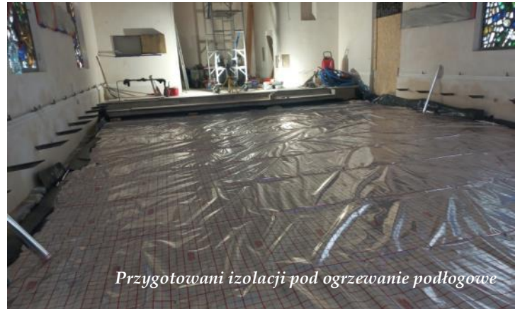
Przygotowani izolacji pod ogrzewanie podłogowe

Składamy serdeczne Bóg zapłać za ofiary na rzecz prac związanych z remontem naszej zabytkowej kaplicy. Pod koniec stycznia zakończono prace związane konsekracją elewacji oraz z wymianą dachu, który został pokryty łupkiem zgodnie z decyzją konserwatora zabytków. Wewnątrz kaplicy zostały zdjęte tynki gipsowe i wykonano tynk wa-