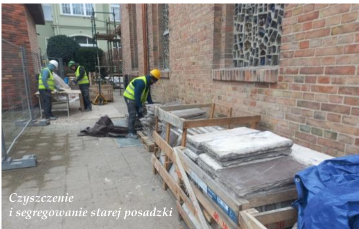
Czyszczenie i segregowanie starej posadzki

Świątynia jest poddana renowacji w ramach Rządowego Programu Odbudowy Zabytków. Gmina otrzymała na ten cel 2 877 084,39 zł, a całkowita wartość remontu wynosi 2 939 700,00 zł. Prace obejmują m.in. generalny remont dachu, oczyszczenie oraz konserwację elewacji i wewnętrznych tynków, schodów, drzwi, a także posadzki. Zaplanowano również wykonanie nowej instalacji teletechnicznej oraz remont instalacji elektrycznej. Konserwacji zostały poddane mozaika, dzwon i krzyż na dachu kaplicy. Niedługo też będą poddane konserwacji również witraże.