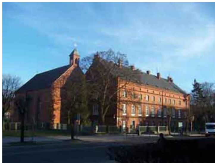
Konwikt Collegium Leoninum. Dawny „Nowy Klasztor” w Wejherowie.

Dnia 1 października 1875 r. został rozwiązany konwent Klasztoru OO. Reformatorów.