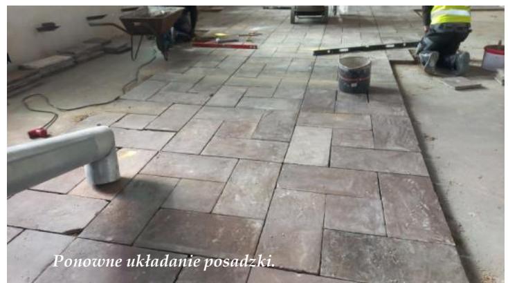
Ponowne układanie posadzki.

Otwarcie kaplicy i poświęcenie nowego ołtarza adoracji planowane jest w listopadzie. Duchowym przygotowaniem do tego wydarzenia będą misje święte, które odbędą się w naszej parafii w dniach 12-19 października 2025.